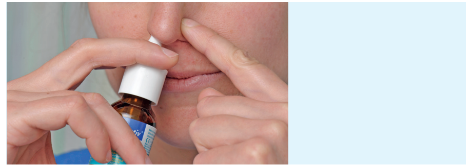
Verwenden von Nasenspray